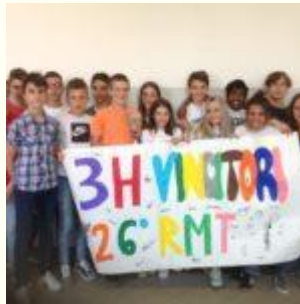
Rally matematico transalpino