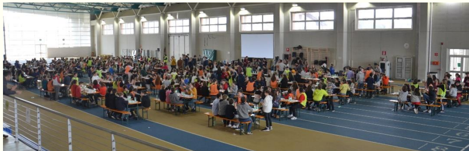
Gare a squadre Kangourou

FONDI REGIONALI «Contiamo, cantiamo, comunichiamo creattiva-mente» - «Friulano»