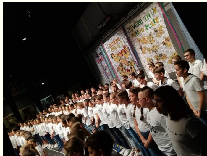
Pensieri, parole, canzoni