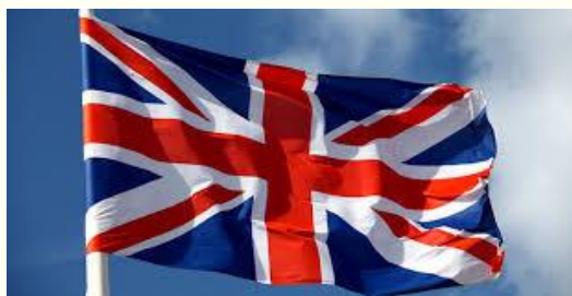
Certificazione KET (A2), Trinity levels 3 and 4

Pindulin al pindulave Moschetin a lu cjalave Pindulin al è colât Moschetin lu à cjapât!